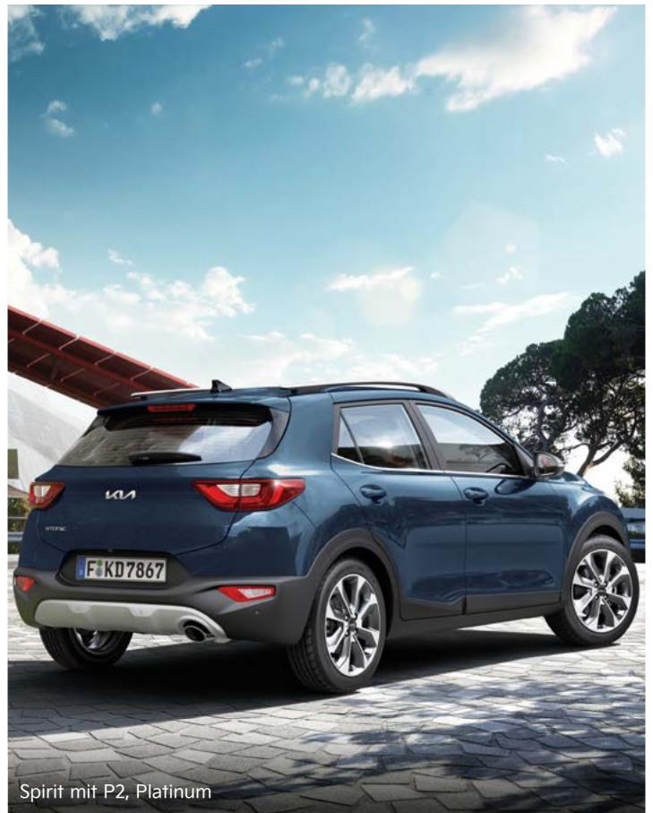
Spirit mit P2, Platinum