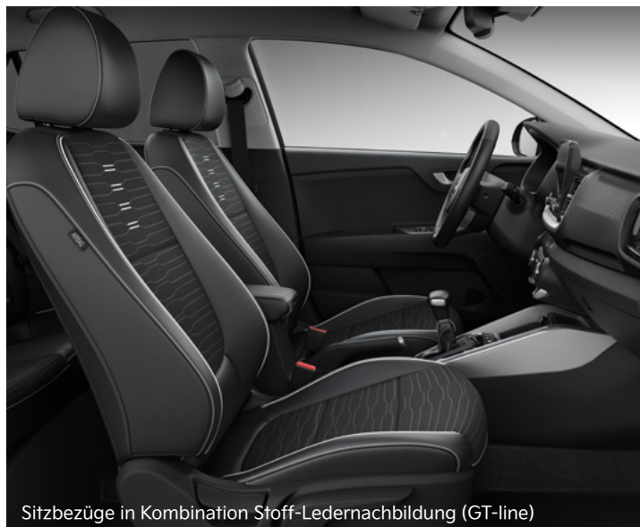
Sitzbezüge in Kombination Stoff-Ledernachbildung (GT-line)