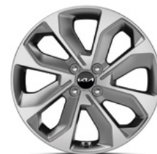
17-Zoll-Leichtmetallfelgen (Spirit und Platinum)