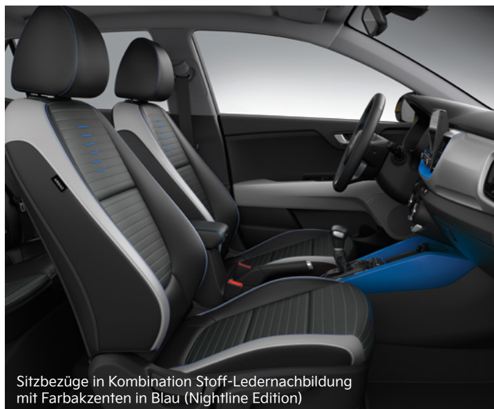
Sitzbezüge in Kombination Stoff-Ledernachbildung mit Farbakzenten in Blau (Nightline Edition)