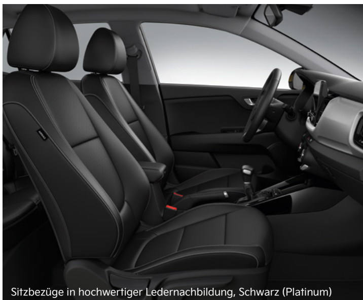
Sitzbezüge in hochwertiger Ledernachbildung, Schwarz (Platinum)