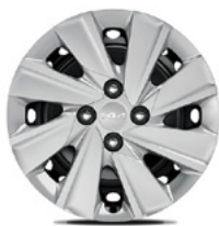
15-Zoll-Stahlfelgen mit Radzierblende (Edition 7)

Bei einigen unserer modernen Metallicfarben werden bewusst unterschiedliche Farbpigmente verwendet. Dadurch können unter bestimmten Lichtverhältnissen, z. B. direktes Sonnenlicht, attraktive Farbeffekte erzielt werden. Zum Teil kann die Farbe changieren, z. B. von Schwarz zu Dunkelblau. Bei den hier abgebildeten Farbdarstellungen kann es aufgrund der Drucktechnik zu Abweichungen zu den Originalfarben kommen. Weitere Informationen zu den Farbeffekten und Grundfarben erhältst du bei deinem Kia-Partner. Metalliclackierungen sind aufpreispflichtig.