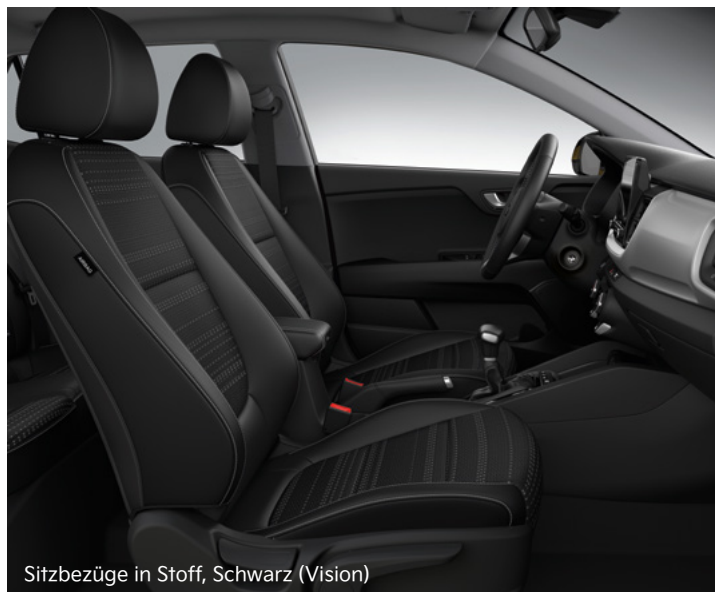
Sitzbezüge in Stoff, Schwarz (Vision)