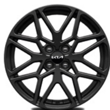
17-Zoll-Leichtmetallfelgen (Nightline Edition)