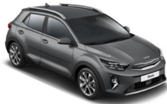
Astrograu Met. (M7G)