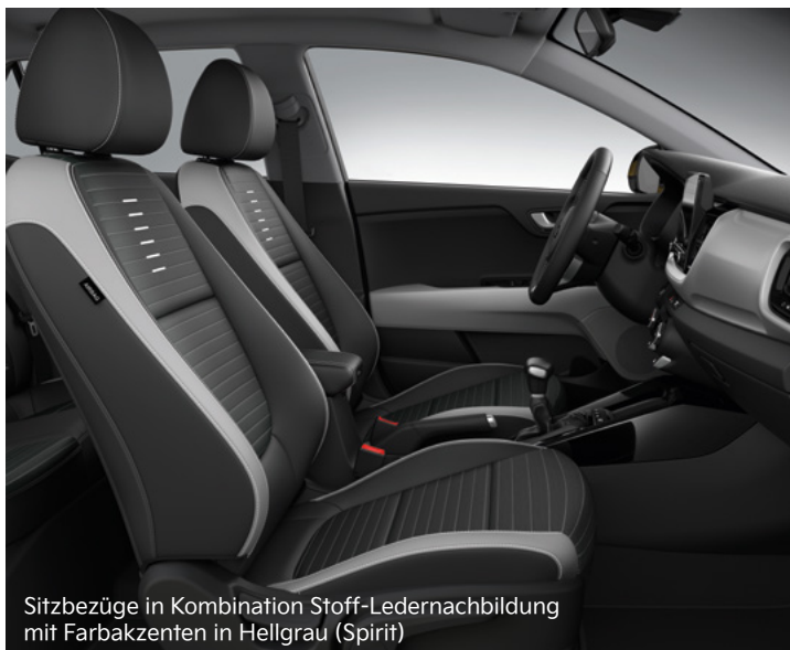
Sitzbezüge in Kombination Stoff-Ledernachbildung mit Farbakzenten in Hellgrau (Spirit)